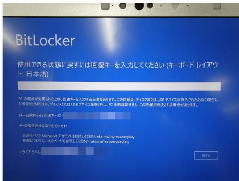
ロックされた状態の PC 画面

BitLocker は、SSD への不正アクセスへの対策として搭載されているディスク暗号化機能です。この機能により PC 内のデータがロックされる場合がございます。ロックを解除するためには、「回復キー」が必要になります。その場合に備えて、事前に「回復キー」を確認しておきましょう。